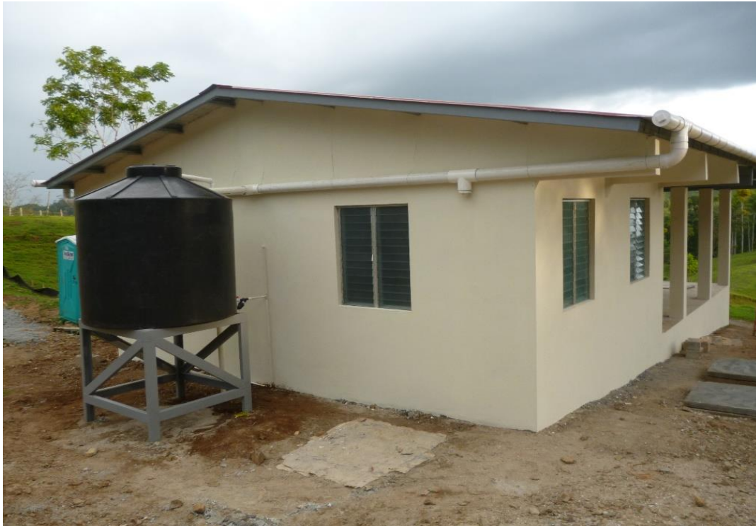
Fotografía 5. Vivienda para familia campesina mestiza reasentada por el proyecto Cobre Panamá, esta presenta un diseño arquitectónico diferente que las viviendas para familias indígenas, costo estimado de unidad US$ 30,000.00 – US$ 35,000.00.

Actualmente la legislación ambiental Nicaragüense cuenta con un marco jurídico muy preciso para la evaluación de los impactos ambientales de los proyectos, que por su clasificación requieren Estudios de Impacto Ambiental, sin embargo en lo relacionado a los impactos sociales el marco jurídico del país presenta vacíos y debilidades.