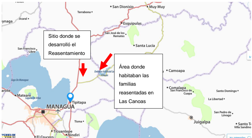
Mapa 1. Macro localización, Comunidad Las Canoas, Km. 50 carretera Managua- El Rama