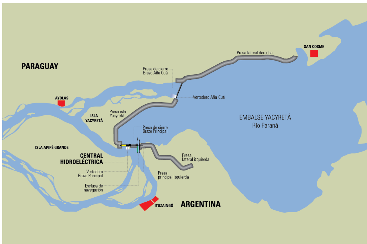
Plano 3. Ubicación Hidroeléctrica Yacyretá, fuente página web Entidad binacional Yacyretá.

La represa está situada, a unos 2 km aguas abajo de los rápidos de Apipé; 70 km al oeste de Posadas (Argentina) y Encarnación (Paraguay); a 300 km al sudeste de Asunción y a 1000 km al Norte de Buenos Aires.