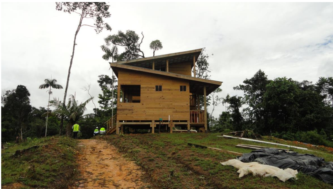
Fotografías 4. Detalles de viviendas compensadas con pertinencia cultural en el proyecto Cobre Panamá desarrollado por First Quantum Mineral y ejecutado bajo un proceso participativo y diseñado con pertinencia cultural, ya que los beneficiarios fueron familias indígenas Gnobe Bugle 36 por la empresa consultora rePlan, proceso de Reasentamiento finalizado en 2015, Costo estimado por vivienda US$ 25,000.00 – US$ 35,000.00 .