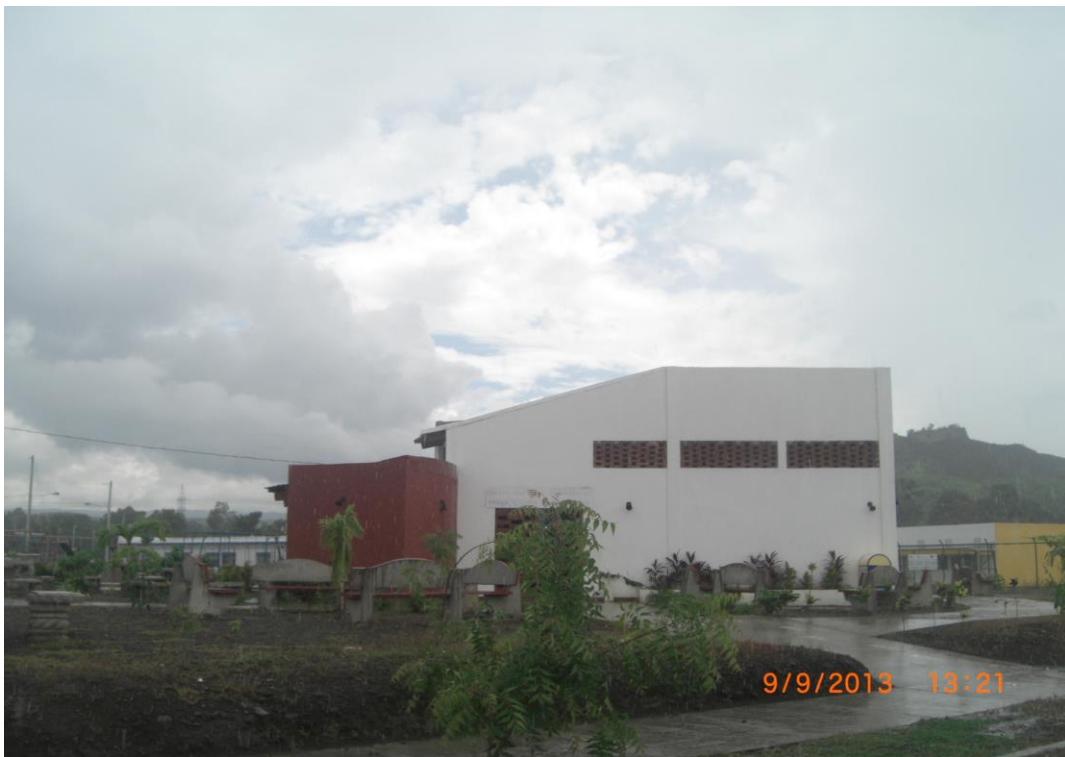
Fotografías 8. Infraestructura social (arriba: Centro de Salud, abajo: polideportivo y parque y construida en el reasentamiento del proyecto Construcción del Relleno Sanitario de la ciudad de Managua.