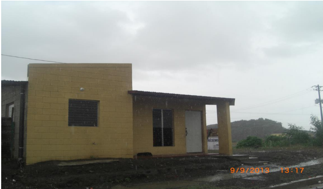
Fotografías 6. Viviendas construidas en el reasentamiento del Proyecto de Relleno Sanitario de la Ciudad de Managua 52 ., Costo estimado por unidad US$ 18,000.00- US$ 23,000.00