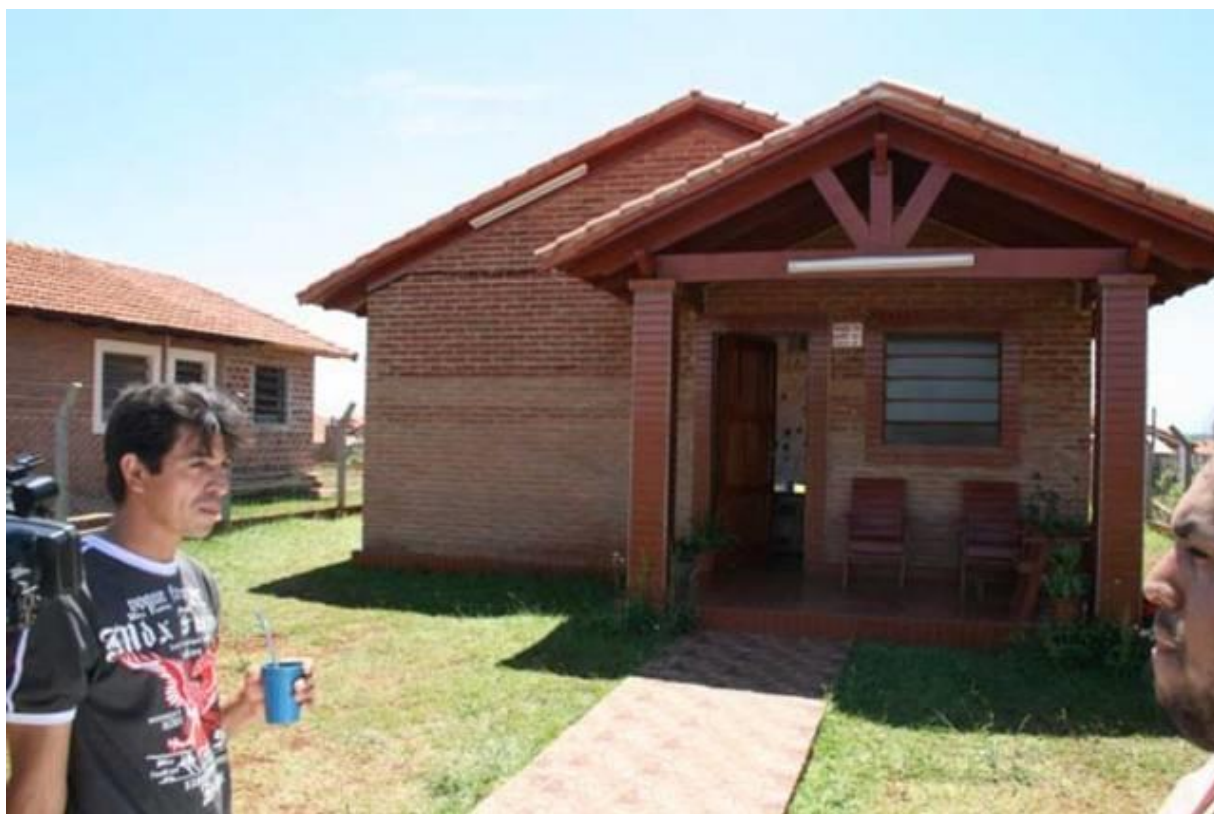
Fotografía 3.: Vivienda típica compensada por el proyecto Yacyreta, costo aproximado por unidad US$ 20,000.00 – US$ 25,000.00

Las que están en construcción demandarán un costo total de casi 64 millones de dólares. Son 975 unidades San Isidro, etapas IV a VIII, y 1.481 viviendas en San Pedro, etapas III a VIII.