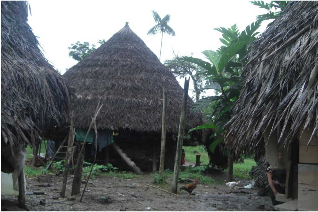
Fotografías 3. Condiciones de viviendas encontradas durante línea base en la comunidad Petaquilla, dentro del área del Proyecto Cobre Panamá desarrollado inicialmente por IMMET y luego por First Quantum Mineral, en la Provincia de Colon, Panamá.