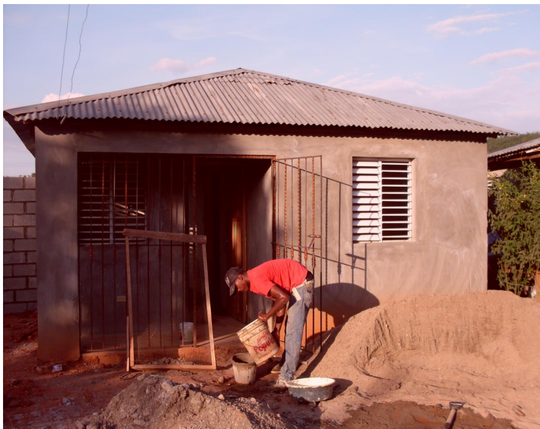
Fotografía 1. Vivienda típica reemplazada por la empresa minera Barrick Gold, en el Reasentamiento El Nuevo Llagal, Provincia Sanchez Ramirez, Republica Dominicana 34

Este proyecto fue financiado parcialmente por la Corporación Financiera Internacional, y esta le solicitó a Barrick Gold, que gestionara los impactos sociales según lo estipulado en las normas de desempeño, específicamente la norma 5. Adquisición de Tierras y Reasentamientos Involuntarios.