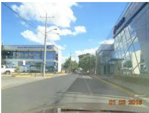
Imagen 7-8. Introducción de nuevas tipologías edificatorias comerciales y logísticas [13] en los tejidos residenciales. Altamira-Managua. La introducción de nuevas tipologías edificatorias surge como emergencia de

la tecnología están ignorando la buena forma de los tejidos urbanos y la capacidad de carga vial de los mismos, no están regulando la intensidad de las actividades comerciales, y parecen ignorar los resultados formales de las operaciones de densificación de los tejidos. Las avenidas principales de tejidos urbanos como Altamira, Los Robles, Bolonia, entre otros ejemplos, son áreas prosperas en negocios, a costa de perder las cualidades de habitabilidad y convivencia. Los vecinos han perdido calidad de vida por la invasión del tráfico, la perturbación de la ventilación e iluminación debida a las construcciones que rompen la escala y el equilibrio de las tipologías. Si bien es cierto, este es un proceso de gentrificación [12] , debido al alza del precio del suelo urbano, que puede ser regulado y controlado en beneficio de la habitabilidad, las últimas intervenciones en estos tejidos demuestran que no existe un conocimiento técnico de la complejidad de la ciudad y los barrios que la conforman. Las construcciones nuevas ignoran las reglas de composición y construcción del tejido urbano, los datos de la parcela en unidad con la edificación y la manzana, en tanto forma de agregación parcelaria y parte ordenadora del trazado son elementos que han caído en el olvido de los técnicos de la ciudad.