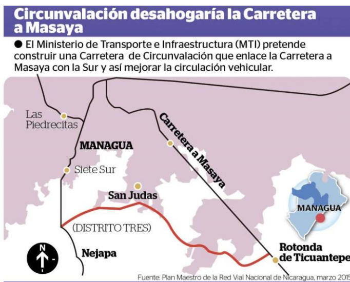
Imagen 4. Muestra el trazado de la variante de carretera de circunvalación Nejapa - Ticuantepe. La nota de prensa, con fecha 25 de abril de 2017, recoge declaraciones de funcionarios de la Alcaldía de Managua, que indican que la construcción de la carretera de circunvalación tiene la pretensión de servir de límite del crecimiento urbano de la ciudad y que además está ligada intervenciones de mejora del funcionamiento hídrico del territorio, a través de la construcción de micro presas para la retención de las escorrentías pluviales.

mecanismo de régimen de suelo se implementarán para prevenir el impacto de un proyecto, que evidentemente es necesario para el funcionamiento de región metropolitana.