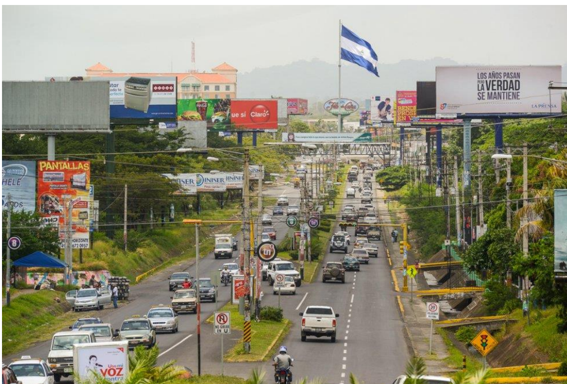
Imagen 6. Contaminación visual del paisaje urbano en el eje de Carretera Managua - Masaya. [10]

Debemos recordar a los “ emprendedores ” que fin último de la ciudad son sus habitantes y el equilibrio con la naturaleza, que construido a través del concepto de paisaje, es el único recurso patrimonial a gestionar, mientras no surjan otras economías.