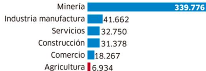
Figura 2. Productividad laboral 2017

en el año 2017), tenemos la obligación funcional de estudiar el problema y plantear modelos alternativos para mejorar la productividad en la industria de la construcción en el Perú.